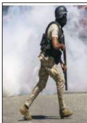
Devant l'ambassade américaine, les réfugiés sont gazés sans pitié par des policiers.

Kidnappings, assassinats à Liancourt, perpétrés par les mouvements « Bwakale » eut forcé les gangs armés à arrêter leurs attaques criminelles, sur les paisibles citoyens, ils aient repris du servi-