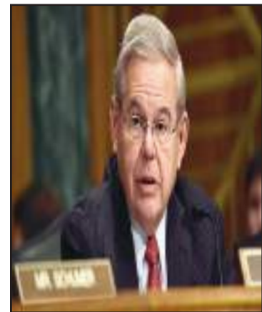
5 Sénateur Bob Menendez

les syndicalistes du transport public ont annoncé trois journées de grève dans les 10 départements géographiques du pays, à commencer lundi prochain, 31 juillet, à continuer le mardi 1er août et le mercredi 2, pour protester contre le prix exorbitant des