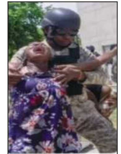
Devant l'ambassade américaine, un policier assume-t-il le rôle de père ou de bourreau...

Il semble que la reprise des hostilités, par les bandits armés, soit bien réelle. C'est l'idée véhiculée dans son édition du 24 juillet de l'organe de presse en ligne Le Facteur Haïti (LFH).