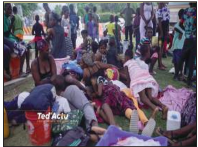
Des réfugiés internes prennent logement devant l'ambassade américaine, à Port-au-Prince.

hétéroclite dont la présence in contrôlée soulève une question de sécurité. D'aucuns pensent que la présence de cette foule non auto-