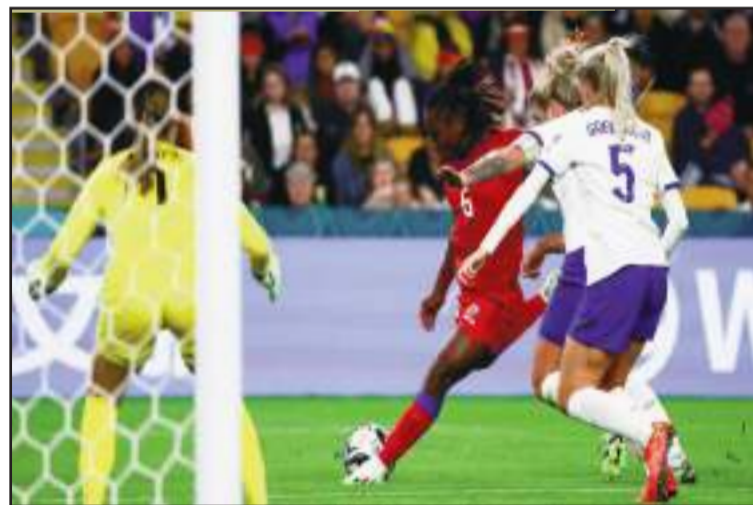
Corvin a su éluder un marquage serré des Anglaises pour atteindre la porte. Domage !

face aux USA. Cette même année 2016, sous la direction du coach américain Shiek Borowsky, Haïti termina quatrième au classement, et rata de justesse une qualification pour le Mondial U-17 fémi-