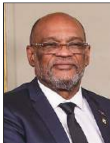
Ariel Henry, after two years as Prime Minister, Haiti is much worse off.

What happened in Haiti in the last few days is a grim reminder of what has been accomplished during the two chaotic years of Ariel Henry's governance as the supreme authority of the land, officially called Prime Minister, but also acting as President, unrestrained by any Parliament, and overseeing the Cour de Cassation , as Haiti's Supreme Court is called, having named eight of the 12 Justices of his choice. Indeed,