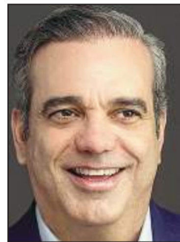
Le président dominicain Luis Abinader

États-Unis, de concert avec ces alliés occidentaux du CORE Group insistent-ils à le maintenir en selle, à l'encontre d'un tollé général du peuple haïtien exigeant son départ inconditionnel dans les plus brefs délais? Est-ce