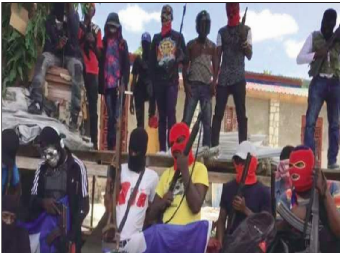
Les bandits du gang 400 Mawozo qui ont mené cette attaque meurtrière contre les locaux de Rhum Bakara.

Henry et les secteurs proches de son gouvernement, ont pour objectif de tenir les bandits en respect, cela semble produire l'effet