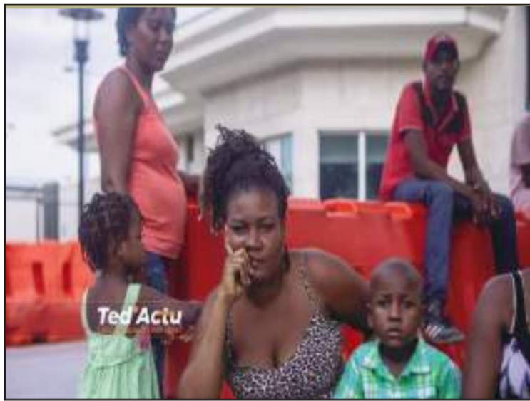
Le décor, devant l'ambassade américaine, aussi des mères et leurs enfants. Mais pendant combien de temps.....

L'insécurité entretenue par les gangs armés imputée aux Américains Il semble que l'envahissement de