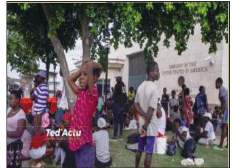
Les réfugiés locaux, devant l'ambassade américaine, sont de tous âges.

En effet, dans différents quartiers de la capitale, particulièrement dans la commune de Pétion-