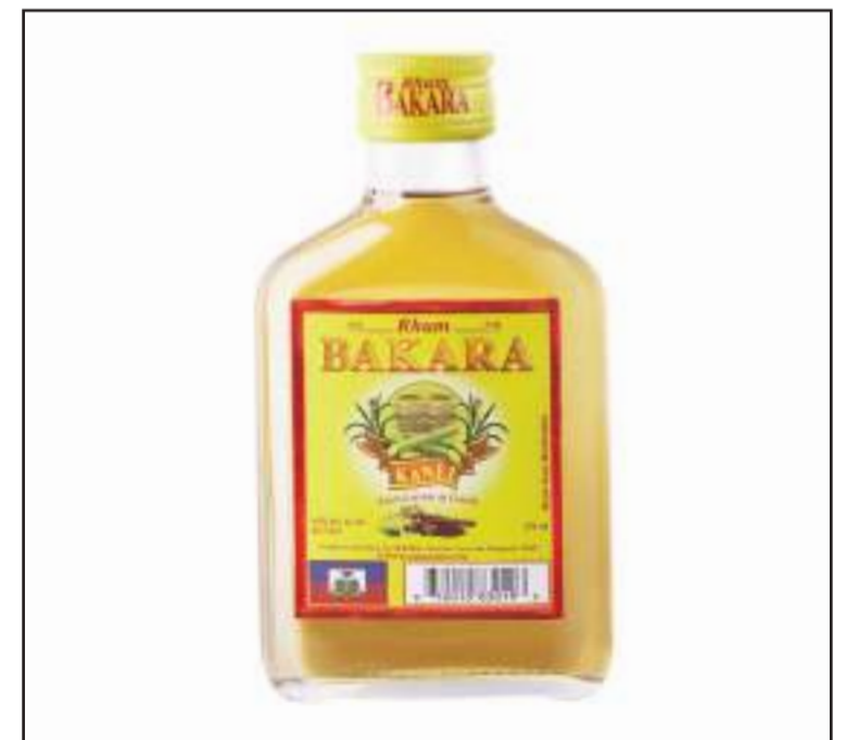
Symbole du rhum Bakara.