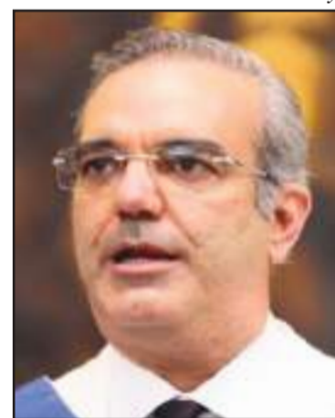
Le président dominicain Luis Abinader

mentation officielle de la présidence, la diplomate a répondu par ces mots : « Dominicains ! Il n'y