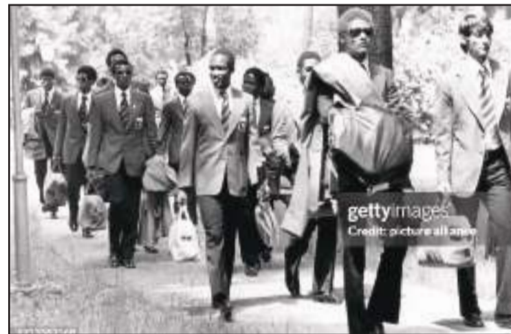
Arrivée de l'Équipe nationale à l'aéroport de Munich, en Allemagne.