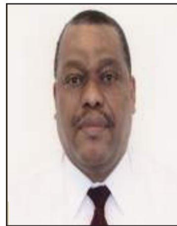
Premier ministre intérimaire Garry Conille.

sujet à caution, par rapport à la véracité des faits. Mais cette situation se complique, puisque la Mission multinationale d'appui à la sécurité (MMAS), dirigée par le général Policier kenyan Jeffrey Otunge, s'est, elle aussi, embarquée dans cette même stratégie.