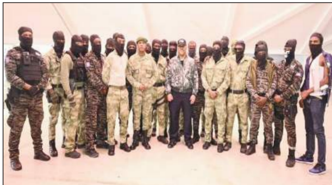
Garry Conille, à l'Académie de police, exprimant sa reconnaissance des efforts des forces de l'ordre pour rétablir la sécurité.

se battre, dans le cadre d'une action punitive contre les hors-la-loi, après le carnage de Pont-Sondé, en vue d'en finir avec les massacreurs, se sont résignées à coexister avec « Gran Grif » et « Kokorat sans ras », les deux principaux gangs qui font la loi dans ce département. Cela en a tout l'air, puisque, non seulement les troupes soi-disant déployées en toute urgence sans l'Artibonite n'ont pas mené d'attaques significatives contre les criminels, les autorités ont même cessé de parler du massacre de Pont-Sondé.