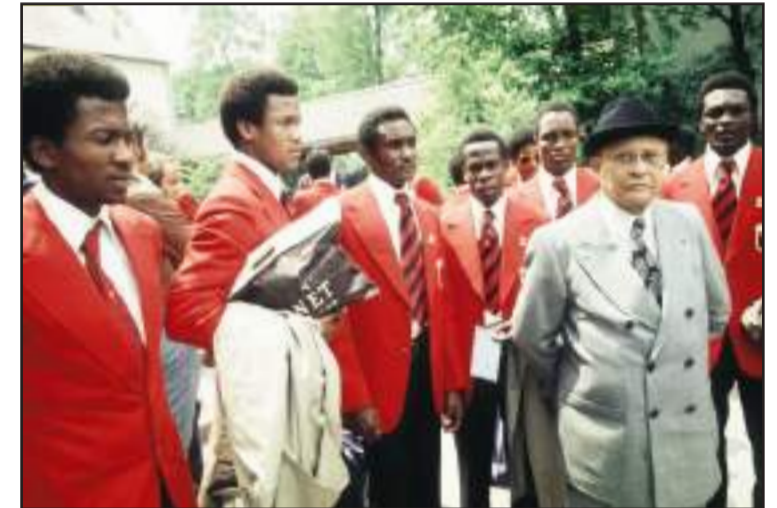
Les joueurs de l'Aigle Noir et le président du Club.

Wa di Bondye depi 5 sezon : 2020, 2021, 2022, 2023, 2024, yon sèl balon pa roule sou Bèlè.