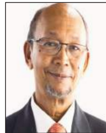
Le président du CPT Leslie Voltaire

Intervenant à son tour, le Premier ministre a dit regretter que cette situation se soit déroulée