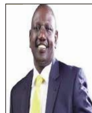
Le président du Kenya William Ruto.

de cette manière. Aussi a-t-il souligné : « J'ai respecté tous les as-