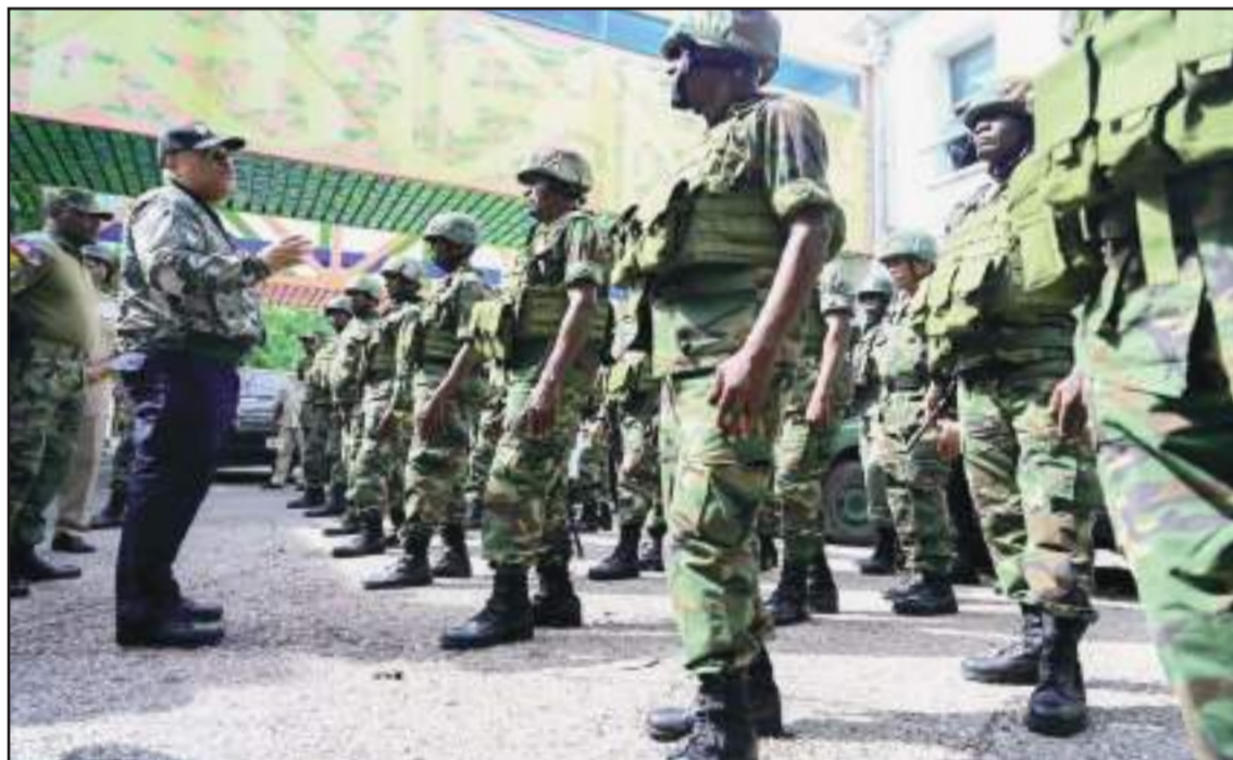
Garry Conille, visitant les FAdH.

déjà les forces de l'ordre. Quand il avait lancé cette déclaration, désormais prise comme une boutade, à savoir reprendre le contrôle du pays « maison par maison,