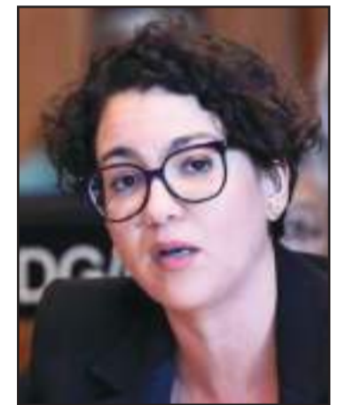
Dominique Dupuy, ministre des Affaires étrangères d'Haïti.

cours de laquelle un conseiller président a traité la chancelière haïtienne de menteuse. Dans ce cas, il faut reconnaître ceci : quand, lors de sa participation à la 79 e réunion annuelle de l'As